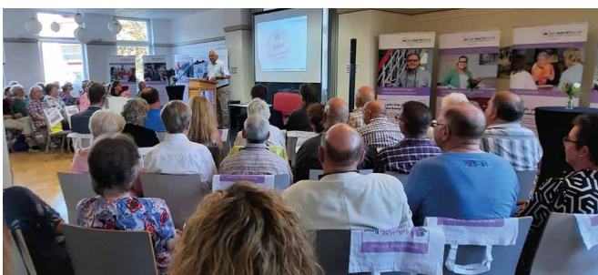
Rund 60 Gäste sind der Einladung zum Jubiläum gefolgt.

Beim „Talk auf der Couch“ teilten Selbsthilfeaktive ihre persönlichen Erfahrungen und Geschichten, die zeigten, wie Selbsthilfegruppen Leben verändern können. Als Abschluss des Abends gab es ein unterhaltsames Kabarett mit Okko Herlyn, das den Charme und die Eigenheiten der Region Niederrhein humorvoll darstellte. Die Jubiläumsfeier war ein bunter Abend mit einem abwechslungsreichen Programm und bot den Gästen die Gelegenheit zum Austausch.