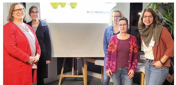
Infoabend „Selbsthilfe und Depression“