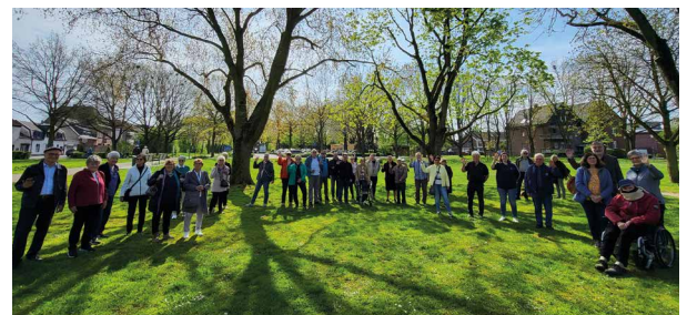
Grenzenloser Austausch in Xanten.