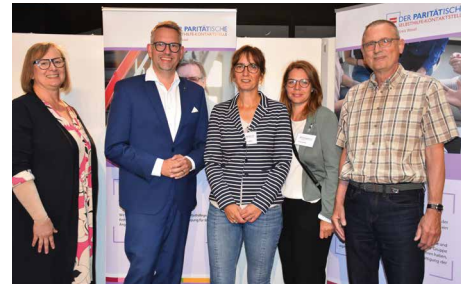
Eröffnung der Wanderausstellung.

Im Rahmen des Jubiläumsjahrs war es uns ein Anliegen der Selbsthilfegruppen im Kreis Wesel ein Gesicht zu geben. Die Roll-Up-Ausstellung „Vielfalt der Selbsthilfe“ war am Hanns-Albeck Platz im März in Moers, sowie im Juli im Kreishaus in Wesel zu sehen. Zwölf Selbsthilfegruppen präsentierten sich auf Ihren Roll-Ups und zeigten, wie bunt und vielfältig die Selbsthilfe ist. Die Roll-Ups wurden in Moers und in Wesel im Rahmen einer Eröffnungsveranstaltung präsentiert.