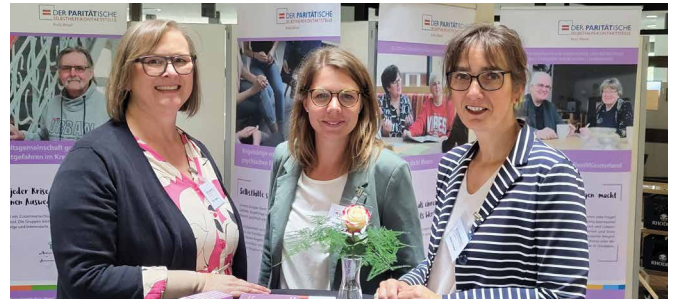
Team der Selbsthilfe-Kontaktstelle Kreis Wesel

Die Selbsthilfe-Kontaktstelle Kreis Wesel arbeitet mit drei Fachkräften, die sich auf einen Stellenumfang von 45,5 Wochenstunden aufteilen. Die Sachbearbeitung ist 19,25 Wochenstunden tätig.