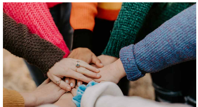
Dreizehn neue Selbsthilfegruppen im Kreis Wesel.