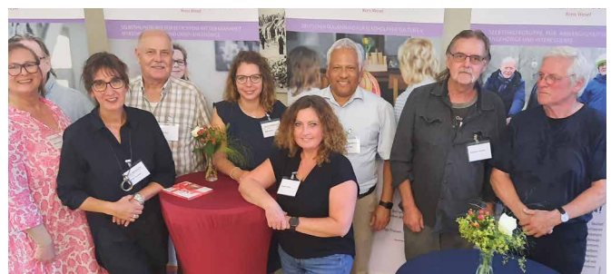
Mitarbeitende des Paritätischen mit Selbsthilfe-Aktiven.